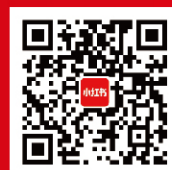
南开大学商学院 专硕招生大使 官方小红书