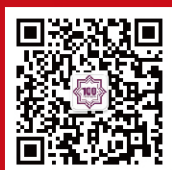
南开大学商学院 专业学位教育中心 官方微信