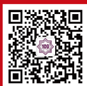
南开大学商学院 专业学位教育中心 官方微信