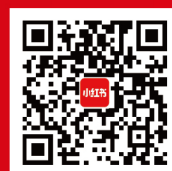
南开大学商学院 专硕招生大使 官方小红书