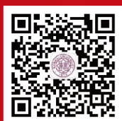
南开大学商学院 专硕学位教育中心 微信公众号