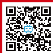
南开大学商学院 专硕学位教育中心 官方B站