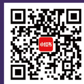
南开大学商学院 专硕招生大使 官方小红书