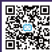
南开大学商学院 专硕招生大使 官方B站