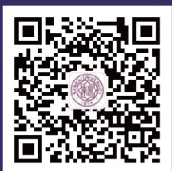
南开大学商学院 专业学位教育中心 微信公众号