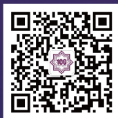
南开大学商学院 专业学位教育中心 官方微信