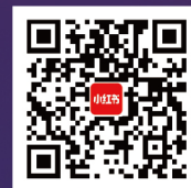
南开大学商学院 专硕招生大使 官方小红书