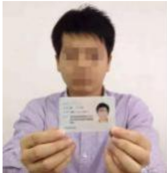
图三：考生验证图例

像头，环绕360°展示本人应试环境，以确定是否符合要求。全部完成后在候考区耐心候考。