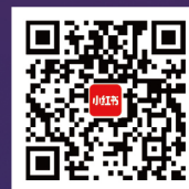
南开大学商学院 专硕招生大使 官方小红书